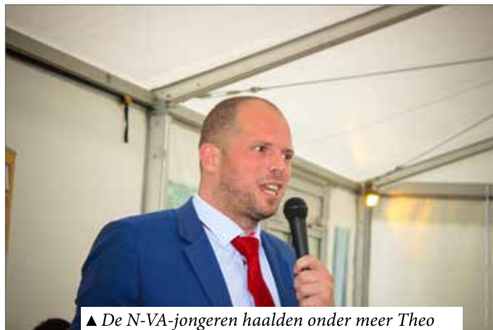
▲ De N-VA-jongeren haalden onder meer Theo Francken naar onze gemeente voor een lezing.

Jong N-VA is op dreef, laat dat duidelijk zijn. Dankzij de Gooikse succesformule waarbij N-VA en Jong N-VA nauw samenwerken, mochten we vorig jaar trouwens een derde meer bezoekers verwelkomen op ons eetfestijn. En ons ledenbestand groeide met 15 procent!